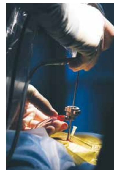
Finlir med små operationsinstrument som gör stor nytta.